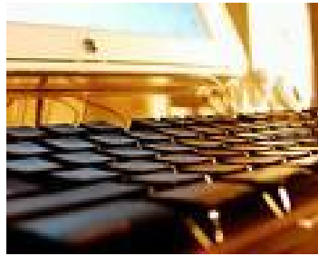
شکل 1-2 یک تصویر

گاه برای نشان دادن یک دستگاه، شیء یا رویداد، تنها از عکس می‌توان کمک گرفت. هرگاه جزء خاصی از عکس مورد نظر است، باید به‌گونه‌ای تهیه شود که اجزای فرعی چشمگیرتر از جزء مورد نظر نباشد (شکل 1-2).