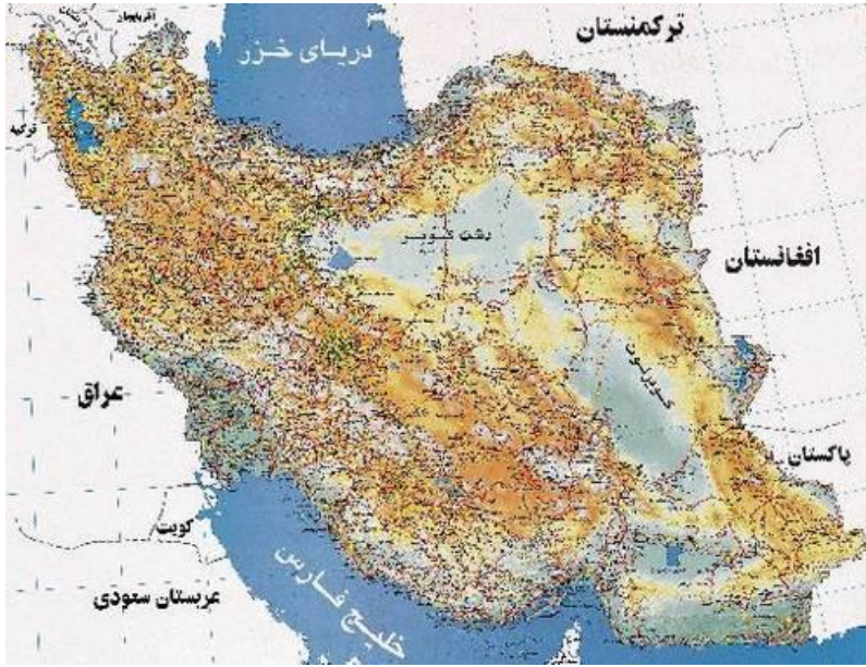
نقشه 1-2 نقشه ایران