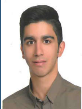
دبیر انجمن علمی مهندسی نفت